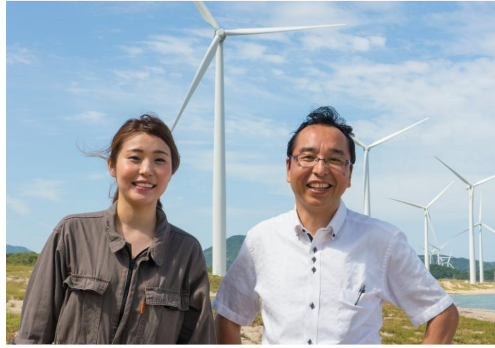
島根県江津市産：紺碧の日本海を吹き抜ける浜風で作られた風力発電の電気