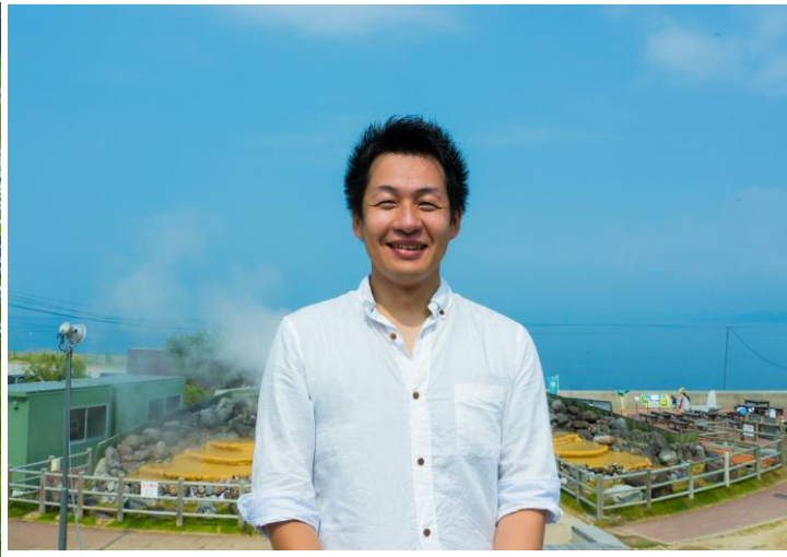
長崎県小浜温泉産：雲仙の大地から噴き出す高温の源泉で作られた温泉バイナリ発電の電気