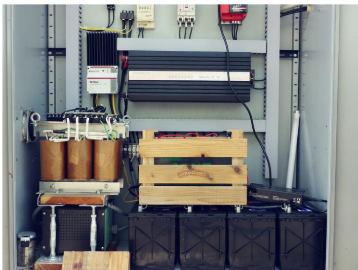
バッテリーに充電してるところの絵 (石徹白地区産)