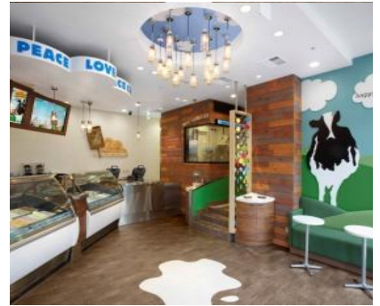
上：表参道ヒルズ スcoopショップ

アメリカ・バーモント州で生まれたスーパープレミアムアイスクリーム「ベン&ジェリーズ」は、1978年、アイスクリームが大好きな2人の青年ベンとジェリーが、ガソリンスタンド跡地に開いた小さなお店から始まりました。ゴロゴロしたチャンク（チョコレートやクッキーの具）が入ったユニークなアイスクリームはたくさんの人を虜にし、現在は世界37か国*で展開しています。日本では 旗艦店「表参道ヒルズ店」、「ららぽーと豊洲店」、期間限定ショップ「エキマルシェ大阪店」の全3店舗で営業中。関東エリアの一部の高級食料品店や一部のスーパーにつづき、関西エリアでも2016年3月からミニカップアイスクリームの販売を開始。店舗は順次拡大中。お店と同じおいしさを、ご家庭でも楽しんでいただけます。