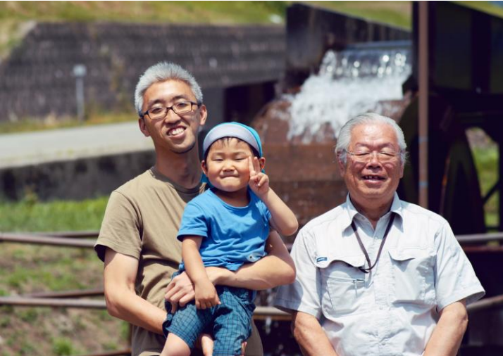
岐阜県石徹白地区産：霊峰白山の清らかな雪どけ水で作られた小水力発電の電気