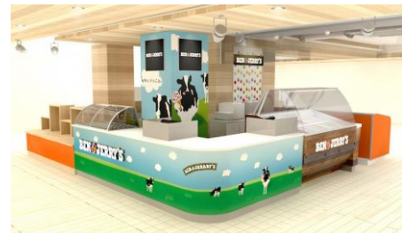
上：エキマルシェ大阪 期間限定ショップ

また、新フレーバー「キャラメルチーズケーキ」など、ご家庭でお楽しみいただけるミニカップも販売中です！