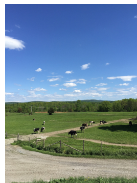
バーモント州にあるベン&ジェリーズの契約酪農場

ベン&ジェリーズでは創業以来、「ビジネスには、そこで得たものを社会に還元する責任がある」という考えのもと、単に利益の一部を社会貢献活動に使うということではなく、ビジネス自体が社会に貢献するものになるよう、事業を展開しています。たとえば砂糖やバニラ、ココアなどの原材料は世界中の生産者と適正な価格で取引しており、アイスクリームとして日本で初めての「国際フェアトレード認証」を受けています。またおいしく安心なミルクのため、牛にも地球にもハッピーな持続可能な酪農法を牧場の人たちと協働で行っています。大切にしているのは「社会のためになることを、楽しい方法で行う」こと。これからもさまざまな楽しい取り組みによって、世の中をよりよくする、おいしいアイスクリームをみなさまにお届けしていきます。