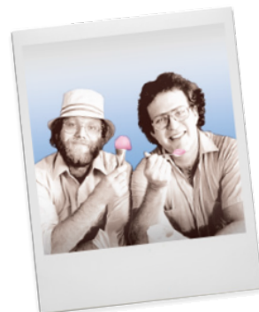
創業者のBen Cohen(左)と Jerry Greenfield(右)

アメリカ・バーモント州で生まれたスーパープレミアムアイスクリーム「ベン&ジェリーズ」は、1978年、アイスクリームが大好きな2人の青年ベンとジェリーが、ガソリンスタンド跡地に開いた小さなお店から始まりました。ゴロゴロしたチャンク（チョコレートやクッキーの具）が入ったユニークなアイスクリームはたくさんの人を虜にし、現在は世界37か国*で展開しています。日本では旗艦店「表参道ヒルズ店」、「ららぽーと豊洲店」、期間限定ショップ「エキマルシェ大阪店」の全3店舗で営業中。関東エリアの一部の高級食料品店や一部のスーパーにつき、関西エリアでも2016年3月からミニカップアイスクリームの販売を開始。店舗は順次拡大中。お店と同じおいしさを、ご家庭でも楽しんでいただけます。