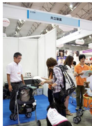
共立製薬のブース内で実施