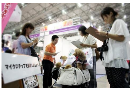
来場者へのご説明は当社スタッフが行う

10 月 6 日（土）に開催される「2012 動物感謝デー in JAPAN」では、特別協賛されている共立製薬のブースで無償装着会を行います。