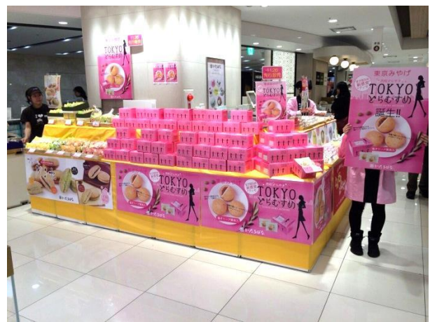
催事販売の様子(渋谷区、千代田区)

一番多い月は1月で、前年2014年に対して2015年度を比べると、予算比334.5%アップ。四か月間全体としては合計195.2%アップという結果でした。