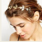
夏らしいヘアスタイルに！ リーフカチューシャ http://goo.gl/3D8LG8