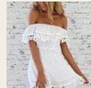
流行の肩見セルック！ オフショルダー http://goo.gl/xJkbJA

【BUYMA(バイマ)】 http://www.buyma.com/?af=601