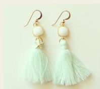
夏気分を盛り上げる！ 貝柄・ヒトデモチーフの ハワイアンジュエリー http://goo.gl/QsPW9D