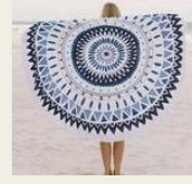
オーストラリア発！ The Beach People(ビーチピープル) 大判ラウンドビーチタオル http://goo.gl/j1lqyM