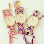
アクセサリ感覚の腕時計！ ミサンガウォッチ http://goo.gl/BKLZgr