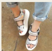
ストラップ付でアクティブに動ける！ 2015年春夏のトレンド スポーツサンダル http://goo.gl/Oz1YBL