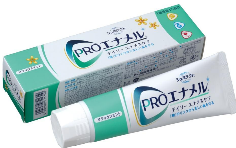
【新製品】 シュミテクト PRO エナメル® デイリーエナメルケア リラックスミント

英国系製薬企業グラクソ・スミスクライン株式会社(本社:東京都渋谷区)では、「シュミテクト PRO エナメル® デイリーエナメルケア」から、新フレーバー「シュミテクト PRO エナメル® デイリーエナメルケア リラックスミント」を2014年2月7日に新発売いたします。