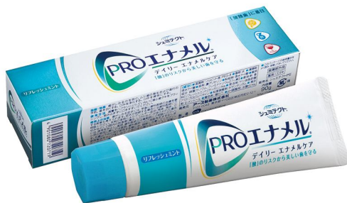
PRO エナメル ® デイリーエナメルケア

「PRO エナメル ® 」シリーズは、ブラッシングの度に歯の表面のエナメル質をケアする独自のエナメルプロテクション処方、口腔内の pH を適正に保ちながらエナメル質を強化して、‘酸’によるダメージから歯のエナメル質を守り、ムシ歯を予防。さらに、知覚過敏も予防します。また、「PRO エナメル ® やさしくホワイトニングエナメルケア」は、‘酸’のリスクからエナメル質を守ると共に歯のホワイトニングのことも考えた製品で、着色汚れ(ステイン)を“削って”落とすだけではなく、改良‘ツインシリカ’配合により、汚れを“包み込んで”落とします。歯にやさしい低研磨性でエナメル質をケアし、歯本来の白さにします。