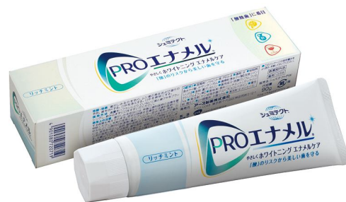
PRO エナメル ® やさしくホワイトニングエナメルケア