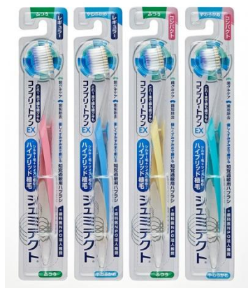
(上) 新製品「シュミテクト®コンプリートワン EX」