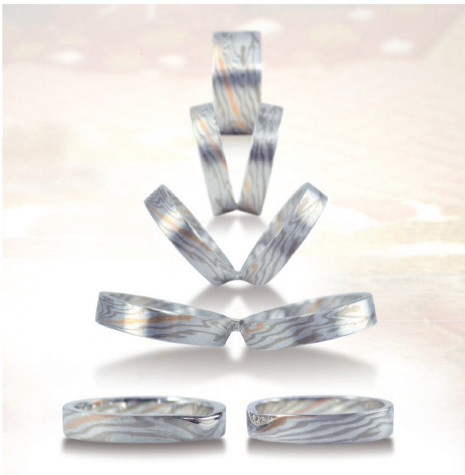
江戸時代の伝統工芸を「生きた技術」としてデザインした商品