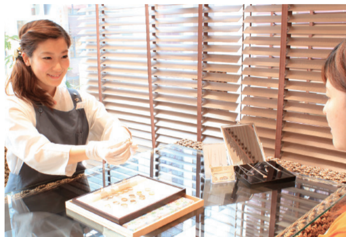
結婚指輪として「世界にひとつ」をカタチにする