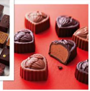
ショコラノゼット