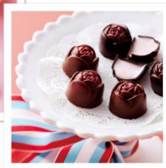
クリストフ デ グローブ