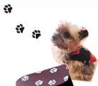
ムッシュ ショコラ