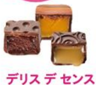
デリス デ センス