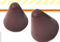
ショコラーデ アトリエ