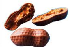
ヴァンデン ヘンデ