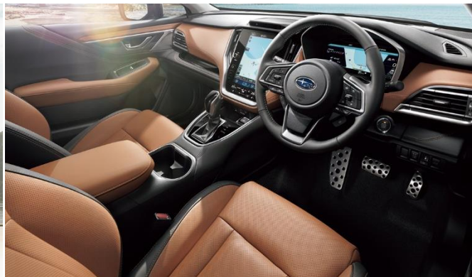
レガシィ アウトバック Limited EX