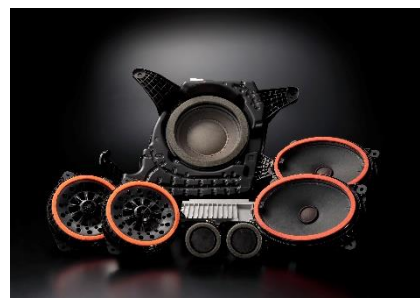
レガシィ アウトバック ハーманカードンサウンドシステム