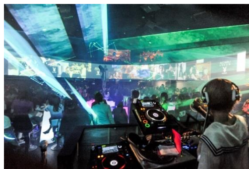
ローンチパーティ