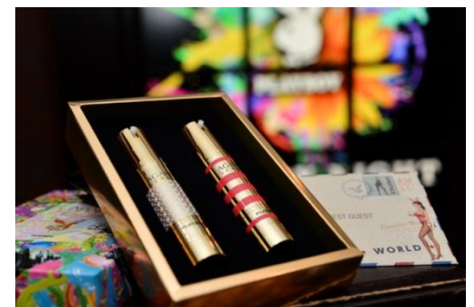
PLAYBOY AGARU SERUM