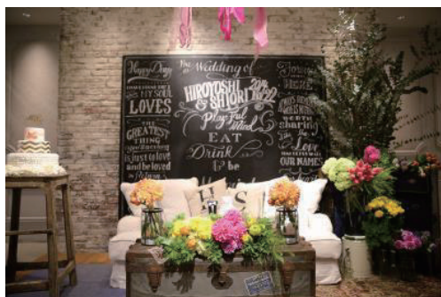
<メインテーブルをソファ席にしたアレンジ例>

ゲストを傍観者にさせない演出として、定番演出1位の「フォトラウンド」に最新演出2位の「フォトプロップス」を取り入れるなど、一工夫することでゲストと一緒に楽しめ、さらに撮った写真をSNSで投稿すれば感動を多くの方とシェアすることができます。