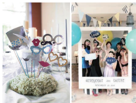
<フォトプロップスを使用した写真撮影例>