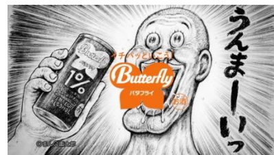
【まん〇画太郎さんのイラストが…パツとあがる！】