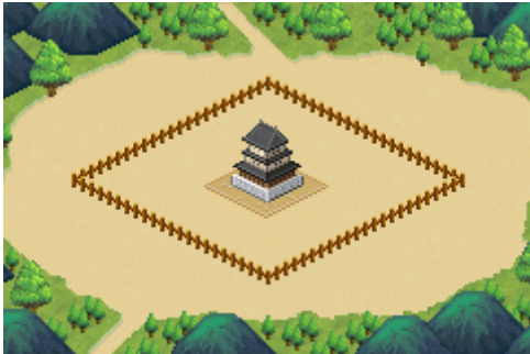
【ゲーム開始時の城下町】

PC 公式サイト： http://www.cave.co.jp/social/shirotsuku/