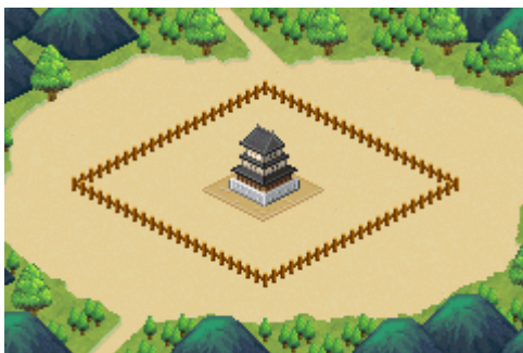
【ゲーム開始時の城下町】