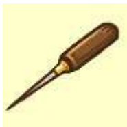
『棟梁の錐(アイテム)』

クイーンズスクエア横浜の何処かに「しろつく」のポスターが設置されており、位置登録した後、ポスターに掲載された QR コードを携帯電話で読み取ることで、クイーンズスクエア横浜イベント限定のアイテムが手に入ります。