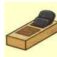
『棟梁の匏(アイテム)』