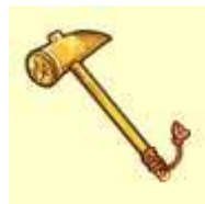
『棟梁の金槌(アイテム)』