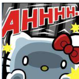
▲驚かして「おじゃまチルドレン」を懲らしめよう！