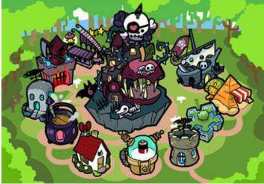
▲「もんすたあ」が住む「もんすたあパーク」