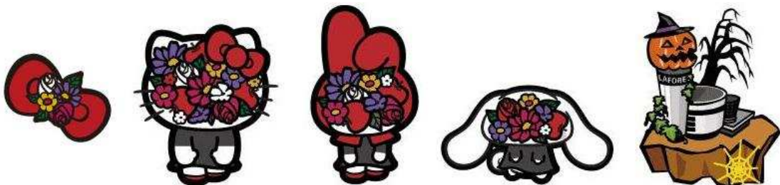
▲プレゼントアイテム例。「もんすたあパーク」をラフォーレ限定アイテムで飾ろう!