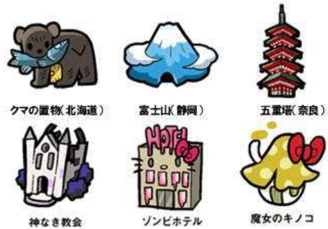
クマの置物(北海道)