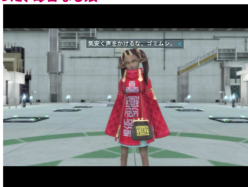
▲真・女神転生 IMAGINE 屈指の毒舌キャラクター『ヤギミヤ』

DESTINYはヤギー族の娘である『ヤギミヤ』に話しかけることで参加できます。但し、このヤギミヤはコンテンツのエスコート役であるにも関わらず、プレイヤーたち人間を「嫌い」だと公言し、数々の言葉を使い、皆さんを罵倒してきます。