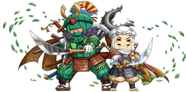
【武装鬼神千手弁慶/武蔵坊弁慶】