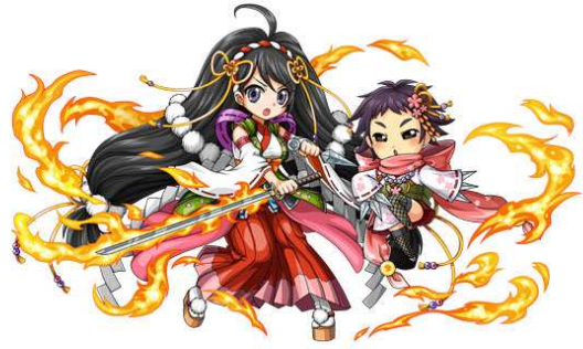
【秘巫女望月千代/望月千代女】