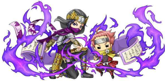
【絶影服部半蔵/服部半蔵】

「しろつく」に登場する歴戦の武将や、「くにつく」に登場する世界の偉人達と同じ名前を持つモンスターがコラボガチャに登場。ゲームの垣根を越え、人気キャラ達がジャグモンの世界で戦います！チームに加えてクエストを突破しましょう！！