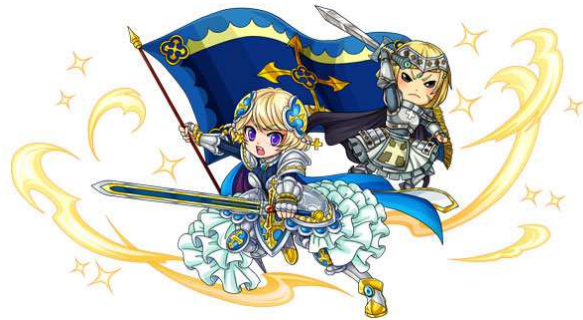
【守護聖女ジャンヌ・ダルク/ジャンヌ・ダルク】