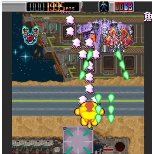
隠しユニットの魚太郎

当社の人気パズルゲーム「魚ポコ」のキャラクター「魚太郎」が隠しユニットとして、参戦します！ 隠しユニットの出現が弾銃フィーバロンのやりこみ要素のひとつです。