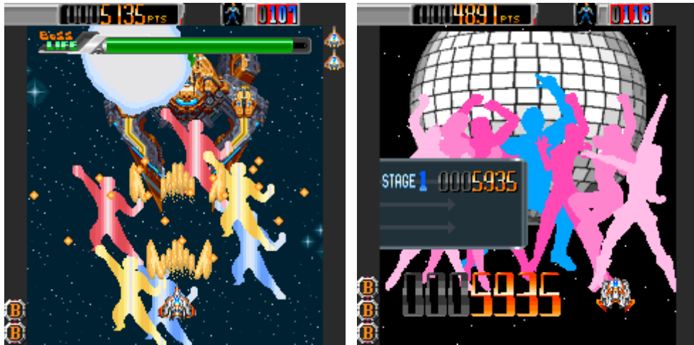
ボム使用時、ステージクリア時の画面イメージ

配信を記念して、期間限定で 1 面のみプレイ可能な 無料体験版 も公開予定です。