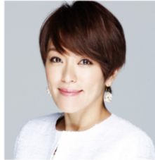
今井絵理子さん 抽選制 参議院議員