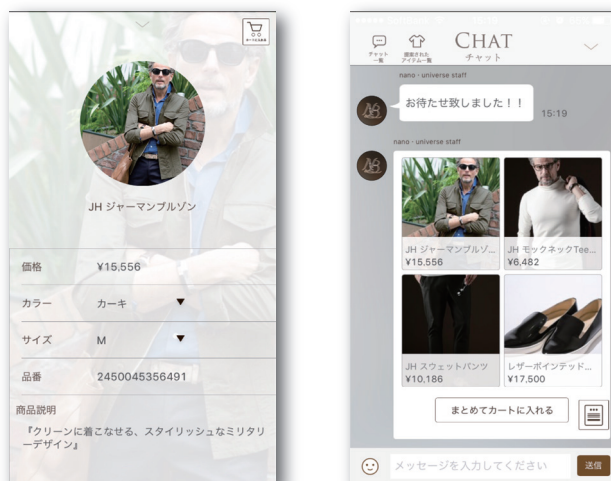
来訪者画面イメージ

・ナノ・ユニバース様 公式 iOS アプリにて、コンシェルジュシステム提供及びセンターの運営を実施。