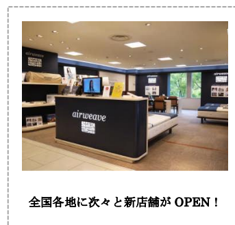
全国各地に次々と新店舗がOPEN!

快適な寝心地が評価され、トップアスリート、JAL国際線ビジネスクラスやファーストクラスをはじめ、石川県和倉温泉「加賀屋」全室等様々な採用実績があります。