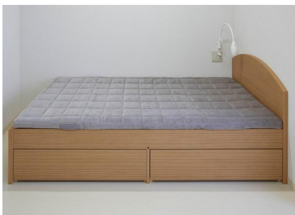
エアウィーヴ四季布団とすみれ寮のベッド

また、4月20日(月)からは、雪組のみなさんが出演する新CMを放送開始致します。魅力あふれるステージを繰り広げるタカラジェンヌの、舞台とは違った素顔をどうぞご覧下さい。