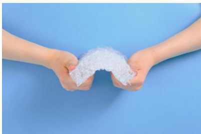
①復元性（体重を押し返す力）が高く睡眠時の寝返りがスムーズ