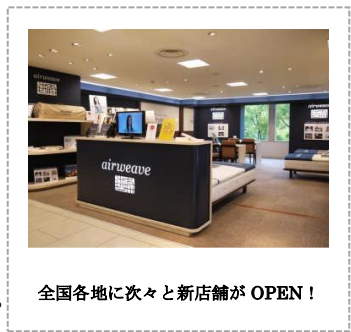
全国各地に次々と新店舗がOPEN!

快適な寝心地が評価され、トップアスリート、JAL国際線ビジネスクラスやファーストクラスをはじめ、石川県和倉温泉「加賀屋」全室等様々な採用実績があります。