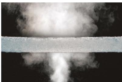
③通気性抜群で夏は蒸れにくく、冬は空気断熱で暖かい