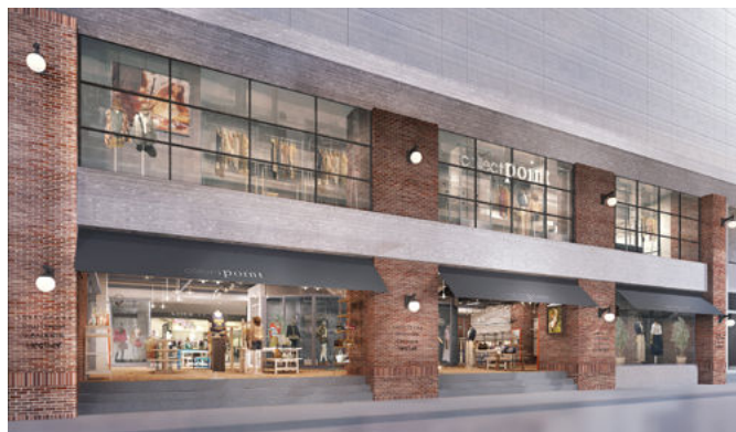
グローバルブランドが立ち並ぶ旺角エリアの大型路面店