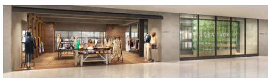
それぞれのブランドイメージを表現した内装。雰囲気もお楽しみいただけます。