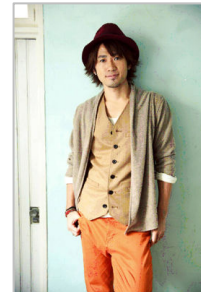
ナオト・インティライミ