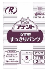
アテント Rケアうす型パンツ(業務用)