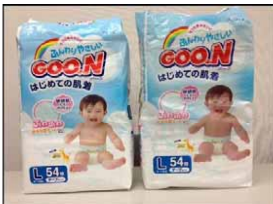
模倣品は赤ちゃんの肌・髪が赤い

模倣品のパッケージに貼付された販売シールの一部 代理商に「南京和風屋語电子商务有限公司」とある