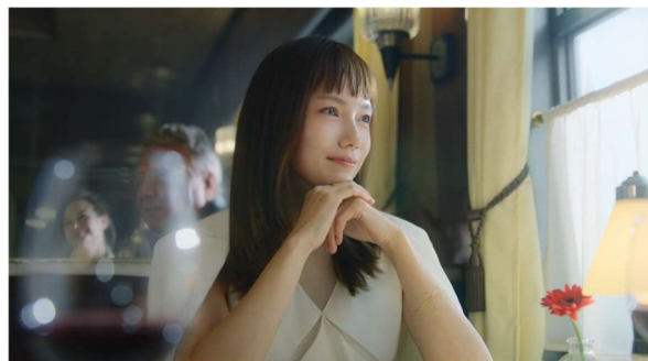
TVCM「列車のふたり ナノマルチショット」篇のカット