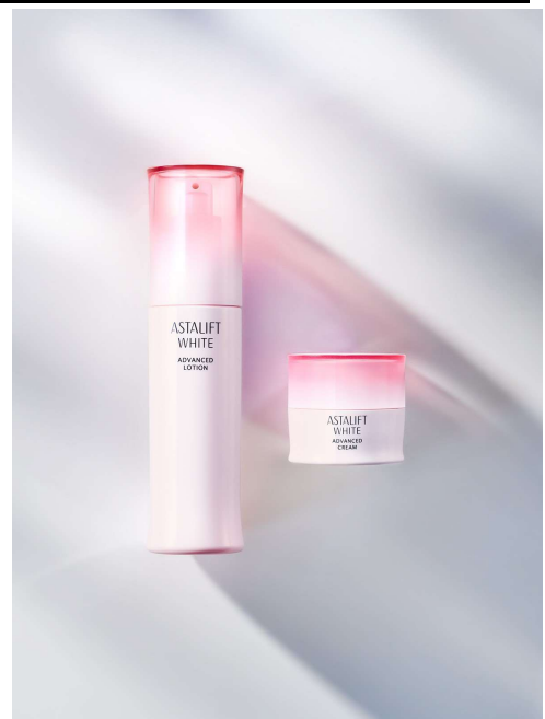
「アスタリフト ホワイト アドバンスドローション」(左) 「アスタリフト ホワイト アドバンスドクリーム」(右)