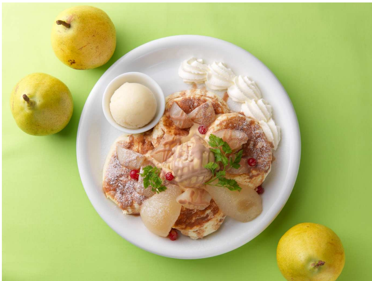
写真：（キャラメルポワール）

北海道小樽で大人気の「小樽洋菓子舗ルタオ」は、北海道の玄関口千歳にお店を構える「ドレモルタオ」より、新作パンケーキ「キャラメルポワール」を11月1日より新発売。丸ごと使った芳醇でジューシーな洋梨ラ・フランス、ほろ苦い自家製キャラメルアイスと、あわ雪のようにとけるパンケーキのくちどけの三重奏をお楽しみください。