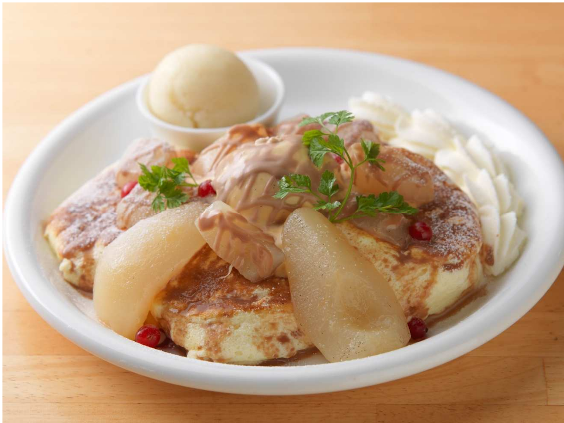
写真：（キャラメルポワール）