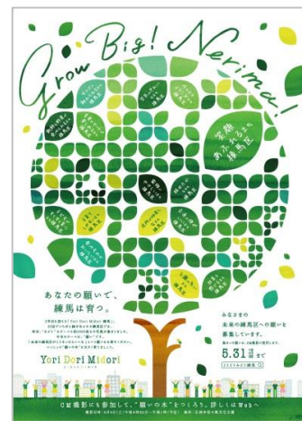
【新キャンペーン メインビジュアル】

本件に関する報道関係者のお問い合わせ先 区長室 副参事(広報戦略担当) 市橋 歩 ☎03-5984-4153 広聴広報課 広報戦略係 岡野・佐藤 ☎03-5984-1089 FAX : 03-3993-1194 E-mail : KOHO06@city.nerima.tokyo.jp