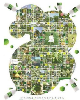
Yori Dori Midori 練馬区 【シンボルアート】