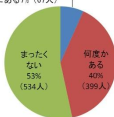
Q. 身内で、あなたの親の将来について話し合ったことはありますか。(n=1000) 頻繁にある7% (67人)