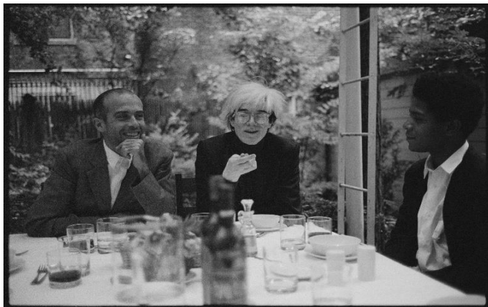
フランチェスコ・クレメンテ、アンディ・ウォーホルとジャン＝ミシェル・バスキア、ニューヨークのペリッツィ邸にて、1984 年

フィリップスは、2015 年にアジアのキー・オペレーターとなって以来、アジア全土のコレクターや愛好家の皆様に最高の西洋美術作品をご紹介することに専念してきました。アジアにおける弊社の著しい成長は、