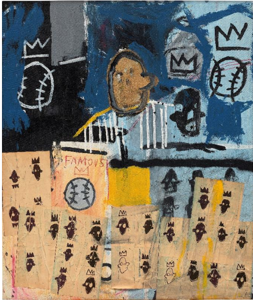
ジャン＝ミシェル・バスキア 《Untitled (Portrait of a Famous Ballplayer)》、1981年、127.3 x 110.5 cm 予想落札価格：650万 - 850万 US ドル 5月14日のニューヨークセールにて出品予定

の遺品から4500万ドルで落札された《Felxible》、前澤コレクションから8500万ドルで落札された《Untitled》(1982年)、そしてバスキアの家族が主催したキング・プレジャー展のメインスポンサーを務めるなど、フィリップスがバスキアという天才へ送る称賛はオークション会場内に留まりません。そして今回、バスキアの最もアイコン的なイメージと、それに劣らぬ来歴と展示歴を持つ素晴らしい作品群を発表できるのは、非常に光栄なことです。フランチェスコ・ペリッツィはインスピレーションに満ちたコレクターであり、バスキアの変わることのない重要性と芸術的ヴィジョンを体現したタイムレスな作品を収集しました。そしてそれらの作品は、40年経った今もインスピレーションを与え、刺激的であり続けるのです」