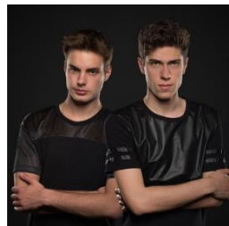
Merk &amp; Kremont