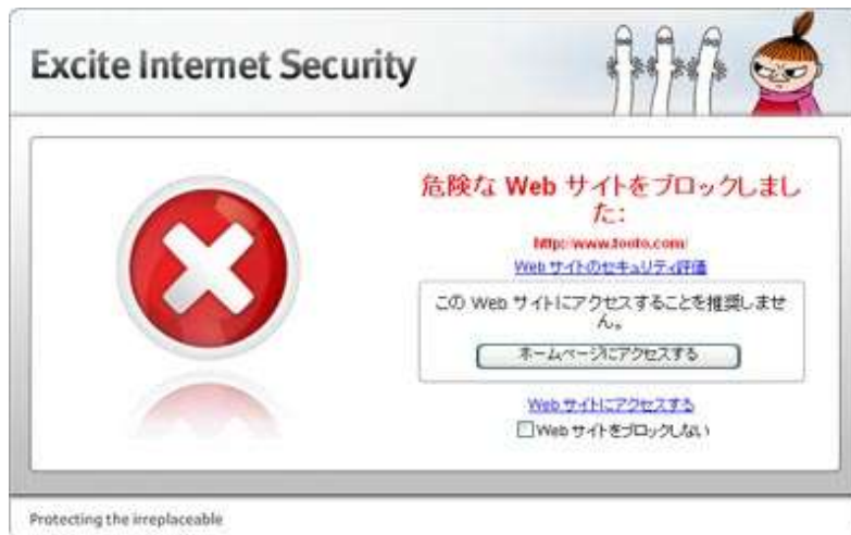
ブラウザ保護の警告ページ例

「Excite インターネットセキュリティ」は、クラウドテクノロジーによって、多層的な防御を実現しており、より精度の高いリアルタイムな防御を可能にしています。同サービスの Windows 版には、悪意のあるウェブサイトによる攻撃からユーザーを守る、「ブラウザ保護」機能が実装されています。これは、ユーザーが危険なサイトへアクセスしようすると、警告ページを表示することで注意を促し、ブラウザを狙うマルウェア攻撃や SEO ポイズニングによる攻撃などによって個人情報などを盗む悪質なウェブサイトからユーザーを守る機能です。この「ブラウザ保護」、迷惑メール対策、有害サイトをブロックするペアレンタルコントロールの定義ファイルをクラウド化することにより、迅速なデータベースのアップデートと、PC への負担軽減を実現しています。