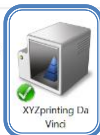
XYZprinting Da Vinci