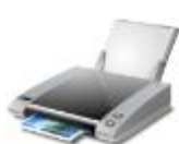
Microsoft XPS Document Writer