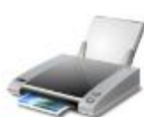
Send To OneNote 2013