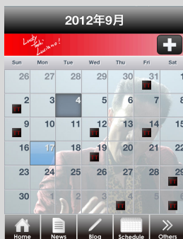
<スケジュール画面>