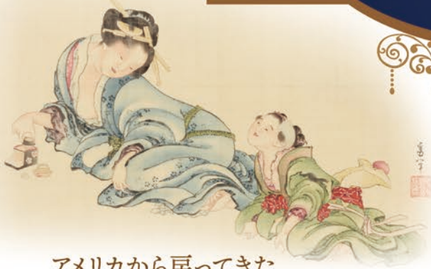
アメリカから戻ってきた 肉筆画『母子図』