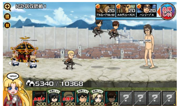
▲原作を再現した数々のステージが展開される