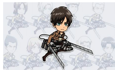
▲多数のキャラクターが登場

イベント期間内には「進撃の巨人」の調査兵団や訓練兵団の兵士達が登場するコラボガチャを展開します。獲得した兵士はイベントステージ内で特殊な効果を発揮しステージ攻略の大きな手助けとなります。