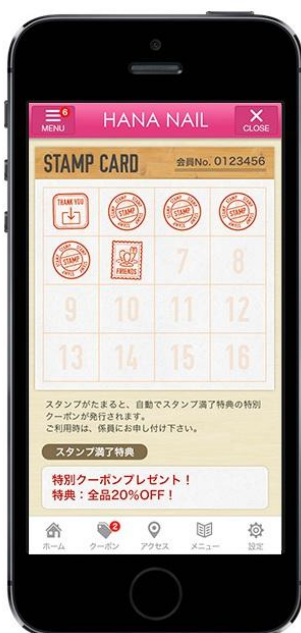
(図 1) スタンプカード