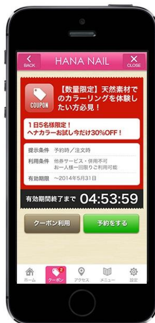
(図 2) クーポン