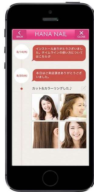
(図 3) 来店(通院)履歴