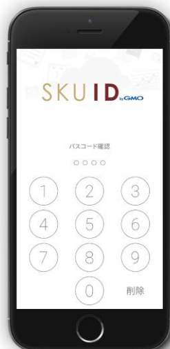
<モバイル認証画面>