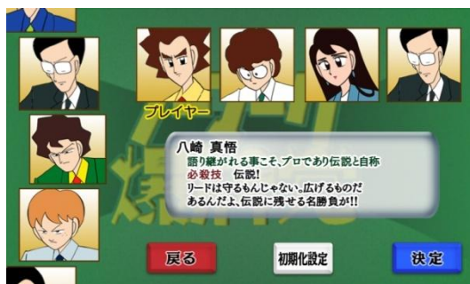
登場キャラクターは総勢 16名

本作は「本格思考ルーチン」を採用することで、本格派麻雀と同等以上の可能性を持つ、打ち筋を実現しています。「必殺技なし」の本格派麻雀と「必殺技あり」でキャラクターになりきって遊べるキャラクター麻雀のふたつの面白さが体験できます。