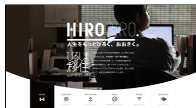
ひろしま移住サポートメディアHIROBIRO