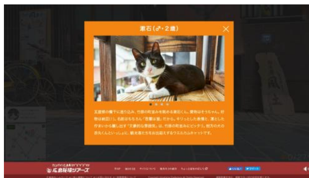
画面イメージ②(ポップアップ画面)