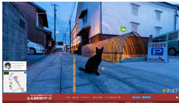
画面イメージ④(ストリートビュー画面)