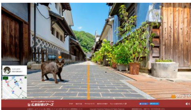
画面イメージ③(ストリートビュー画面)