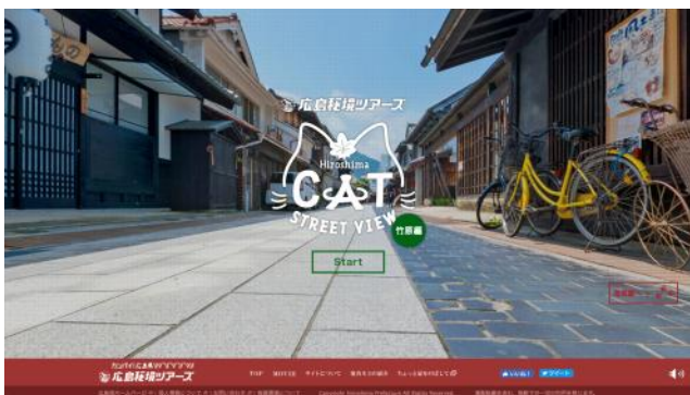
画面イメージ①(トップ画面)