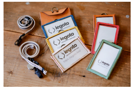
鹿革のカードケース