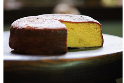
柚子ヴァターケーキ。