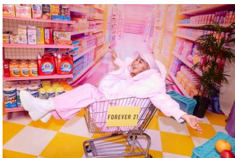
青山テルマコラボ モンスターブルゾン 17,600円(税込)