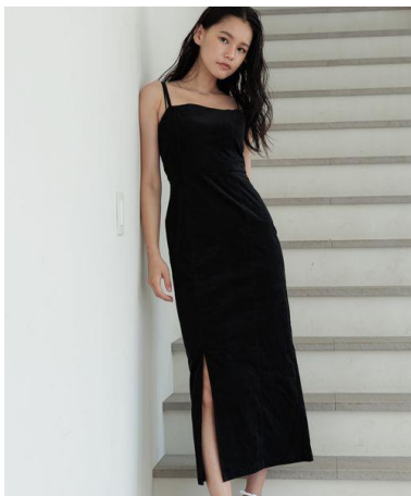
ラインキャミワンピース 6,050円(税込)