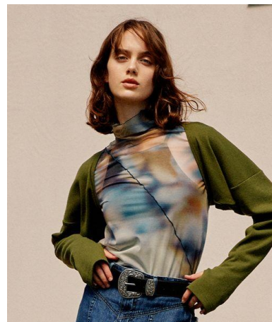
アソートシアームロウ ハイネックプルオーバー 2,200円(税込)