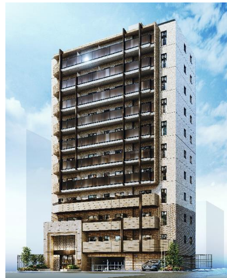
リビオレゾン横濱関内