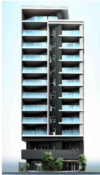
リビオレゾン入船