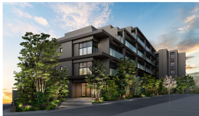
グランリビオ甲陽園