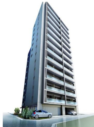
リビオレゾン中村橋ステーションプレミア