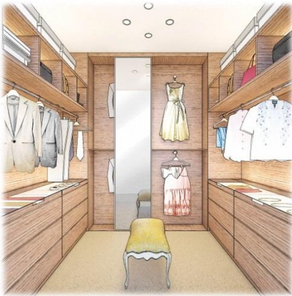
＜夫婦の大型ウォークインクローゼット＞