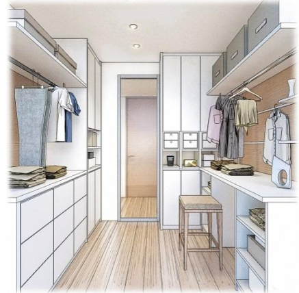
＜ワーキングママPJアイデアプラン：家事コーナー＞