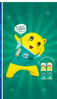
オリジナル壁紙（スマートフォン用）