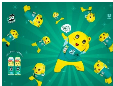
オリジナル壁紙（PC用）